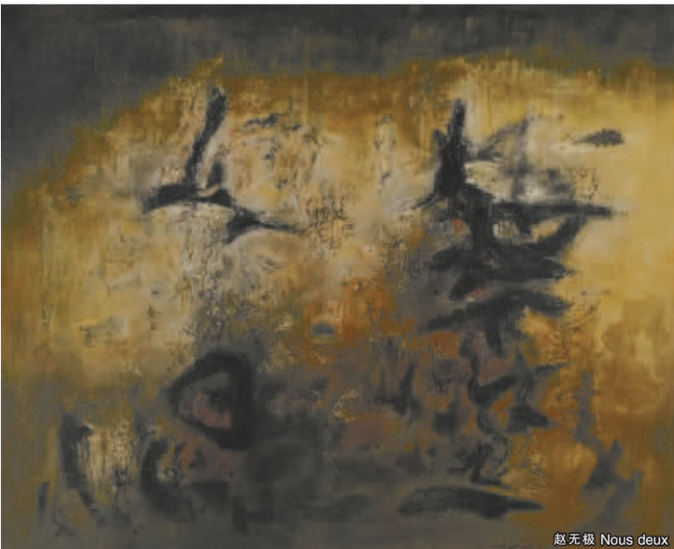
赵无极 Nous deux